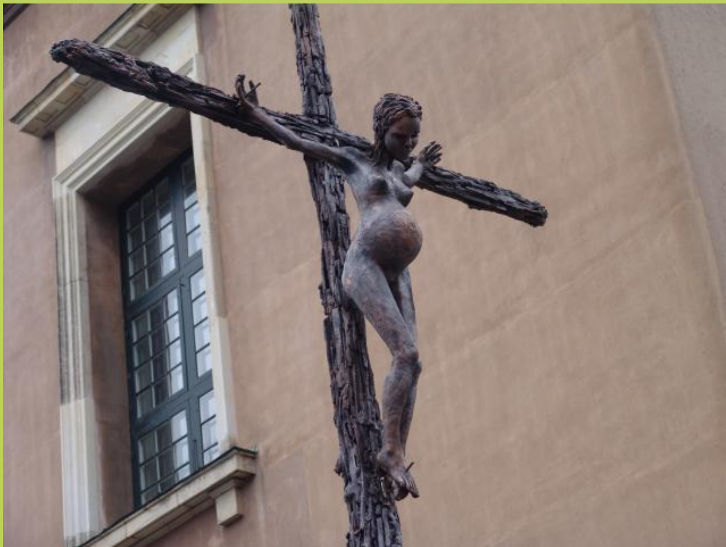
Foto: I guds navn ,2006 Mål: 160 x 160 x 40 cm Materialer: Kobber, stål af Jens Galschiøt .